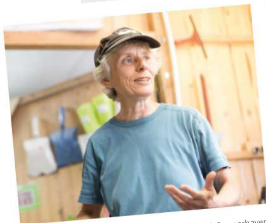
Mit Fantasie wird's bunt im Quartier – Förderwerk Bremerhaven, auf Seite 18 und 19