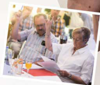
Jedes Mitglied kann aktiv seine Stimme abgeben.