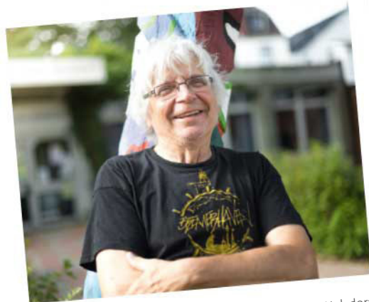
Wo im Süden Ideen sprudeln – Kulturladen Wulsdorf, auf Seite 12 bis 15