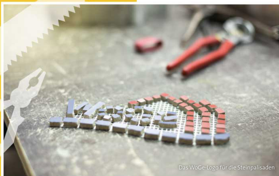
Das WoGe-Logo für die Steinpalisaden

Das Förderwerk Bremerhaven versteht sich seit 1989 als inklusives Beschäftigungsprojekt in Bremerhaven und umzu. Das Bundesprogramm „Bildung, Wirtschaft, Arbeit im Quartier – BIWAQ“ fördert Arbeitsmarktprojekte in Quartieren. Innerhalb des BIWAQ-Projektes „Die Mischung macht's“ bestreitet das Förderwerk Bremerhaven das Teilprojekt „Jobwerkstatt Wulsdorf“. Das Förderwerk Bremerhaven ist somit ein arbeitsmarktpolitischer Dienstleister.