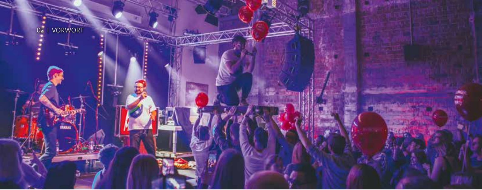
Auftritt der Band Faakmarwin bei einer vergangenen KLUB NACHT