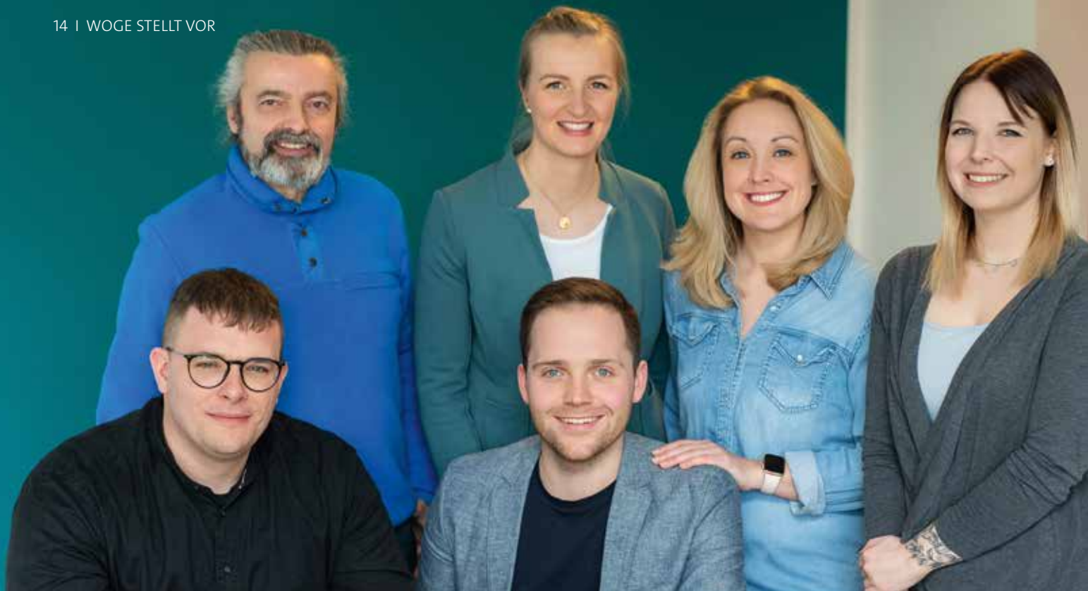
Das Team von „CareCreative“