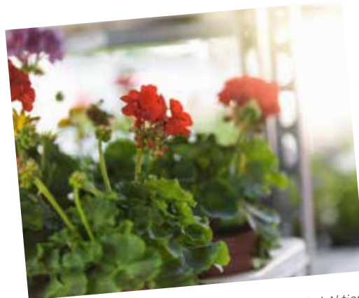
Die WoGe-Blumenzwiebel-Aktion! auf Seite 9

KLUB NACHT, die vierte! | Wir sind für Sie da | Impressum