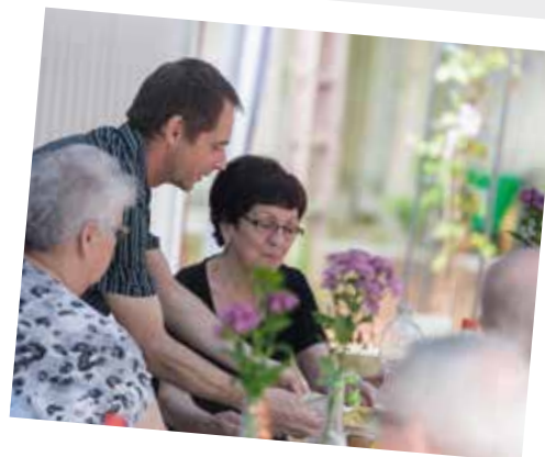
Sonderthema „Nachbarschaft“ auf Seite 10 bis 13